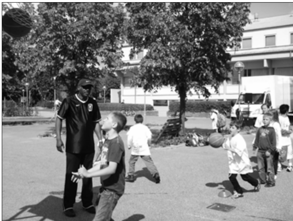
Streetbasket med GAM3