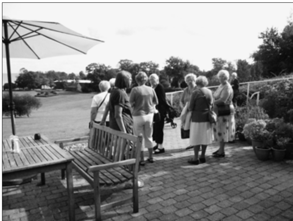
Onsdagsklubben på udflugt august 2009