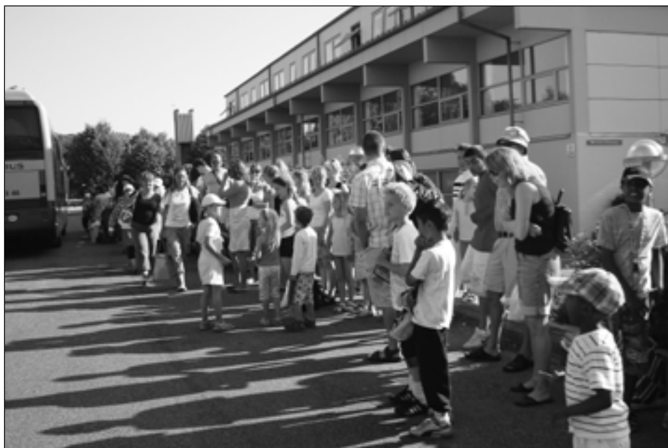
Tur til Bon Bon Land