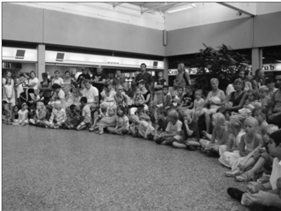
Tilskuere til cirkusforestillingen.