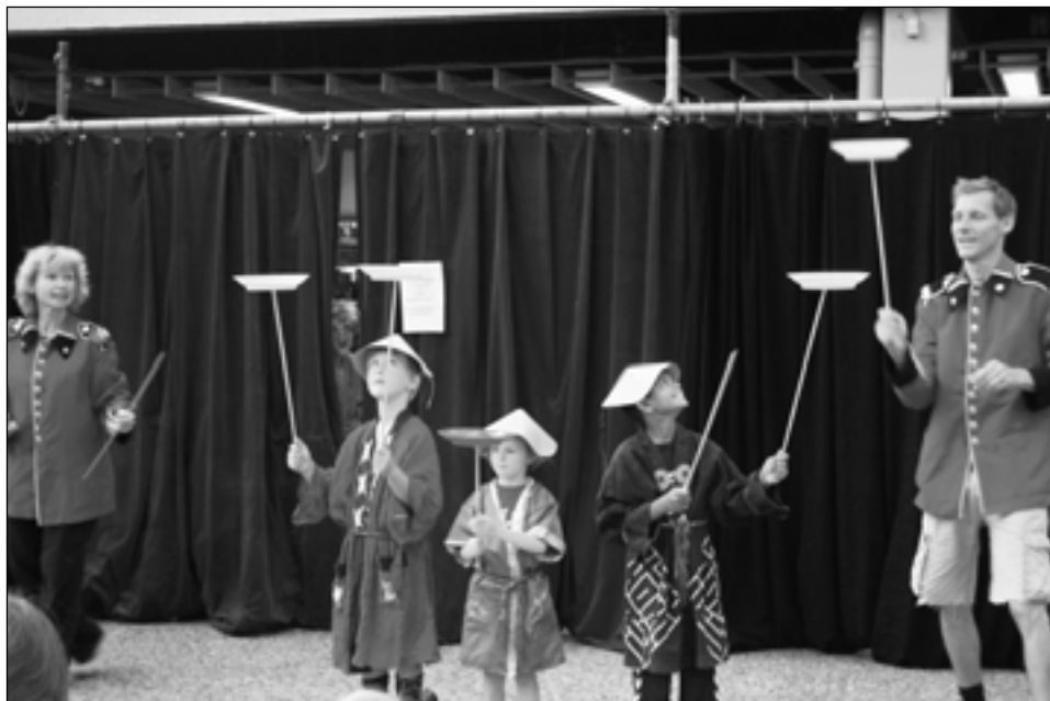
Cirkusoptræden på centertorvet