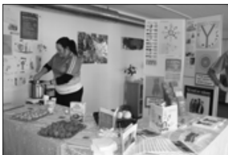
KRAM 09 smagsprøver

Projektet lagde lokaler til KRAM-butikken d. 1. oktober. KRAM står for Kost, Rygning, Alkohol, Motion. Det var Afdelingen for Sundhed og Forebyggelse i Ballerup kommune der stod bag, og ud rådgivning om ovenstående emner kunne man tale med Diabetes-foreningen og Hjerteforeningen. Det var muligt at få lavet en sundhedsprofil, hvor kondi, blodtryk og andet blev målt. Dejlige smagsprøver blev budt, og pjecer for børn og unge lå fremme med informationer om rådgivning, rettigheder med mere. Arrangementet var velbesøgt med 65 deltagere, heraf 30 børn.