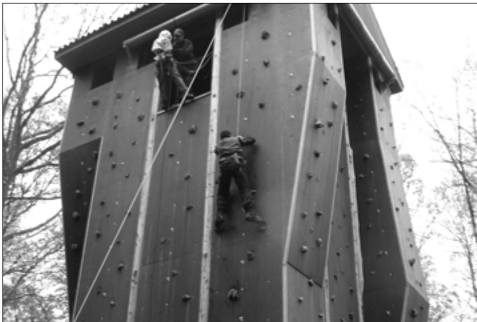
En som rapeller og en der klatrer, overst ses instruktøren.