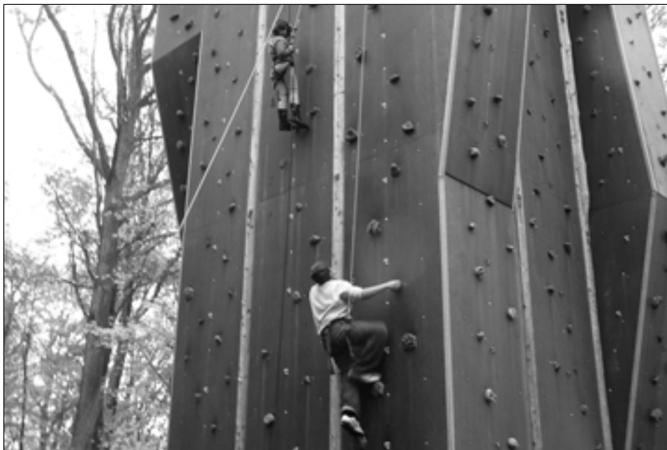
Man får brugt energien på klatrevæggen hvadenten det er på vej op eller ned.