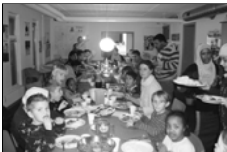
Glimt fra dagens madklub, hvor 33 børn og voksne deltog