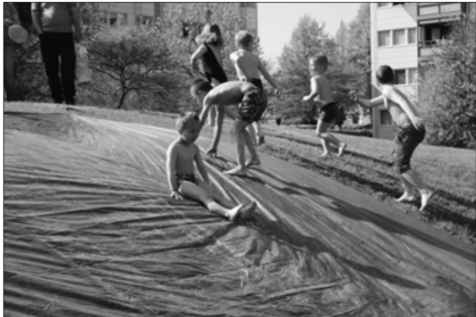
Torvedag 2010, sæbeglidebane