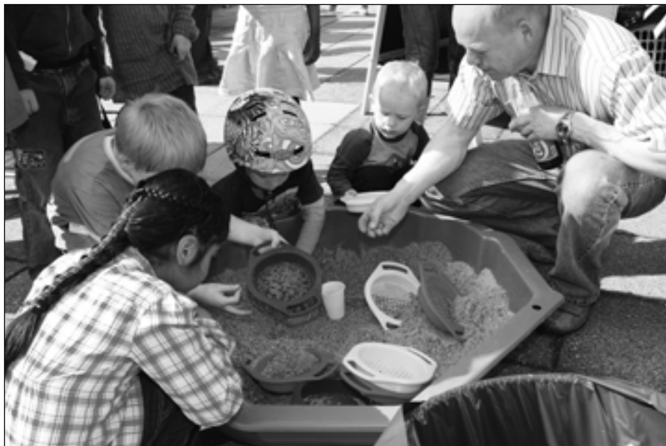
Torvedag 2010, tandplejens find en tand i sand