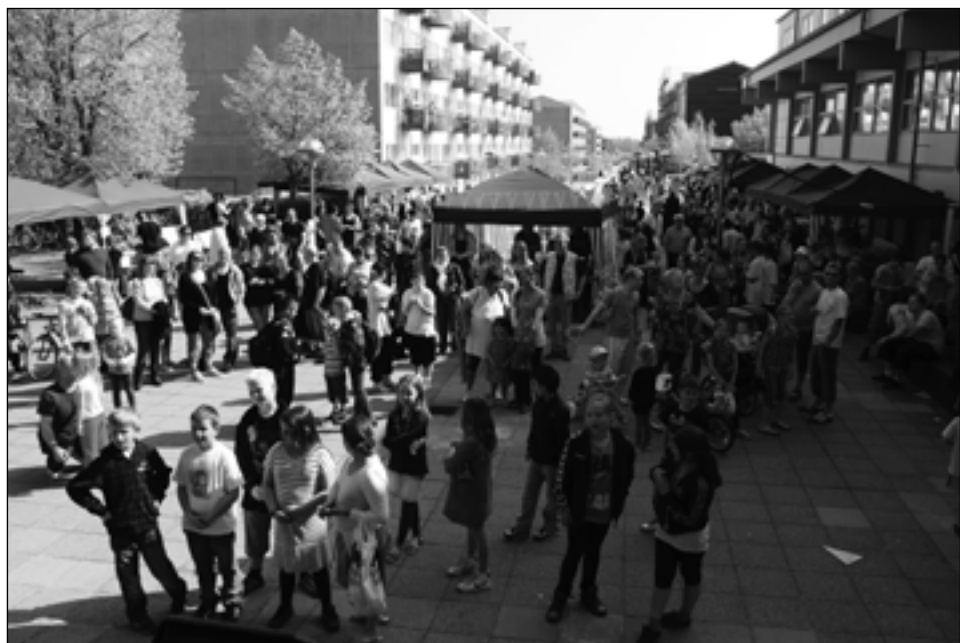
Torvedag 2010, mange folk og boder set fra scenen