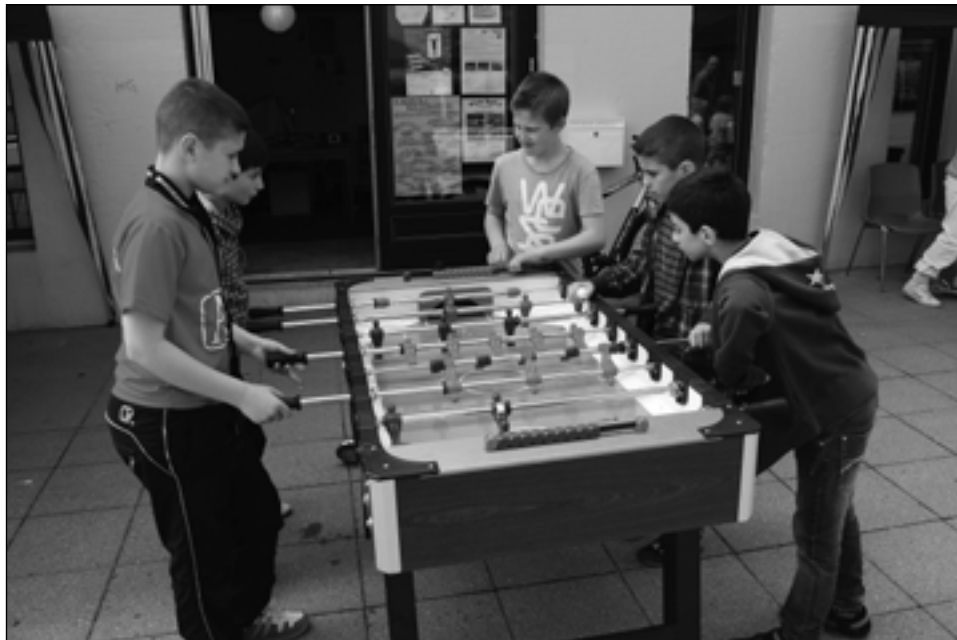
Torvedag 2010, afprøv evnerne i bordfodbold inden VM