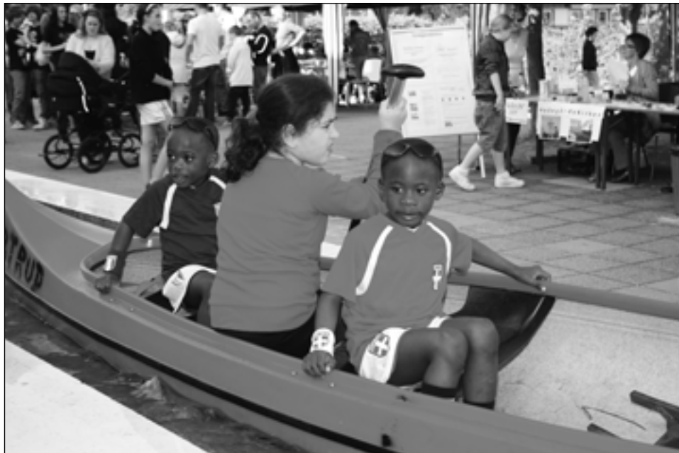
Torvedag 2010 med børn i kano på vandkaskaderne