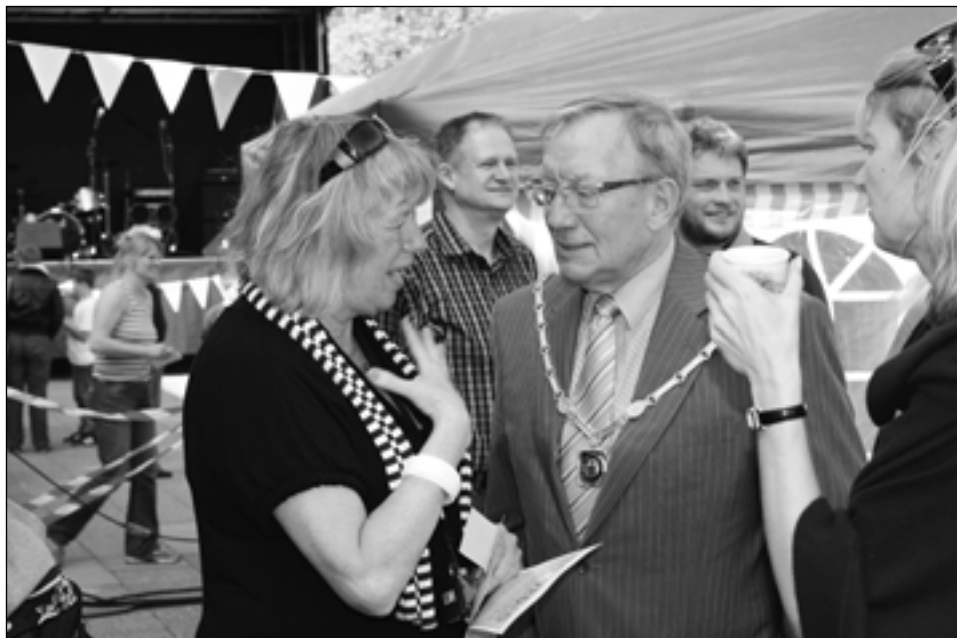
Torvedag 2010, borgmester i snak med folk