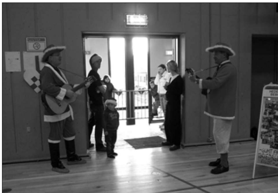
Juletræsfest i Hedegårdshallen